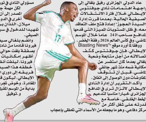
مركز دفاعي، وهو ما يجعله من الأسماء التي تتخطى بإعجاب

عاد الدولي الجزائري رفيق باغالي إلى واجبه اهتمامات نادي جوفنتوس الإيطالي خلال فترة الانتقالات الصيفية الحالية، بعدما قررت إدارة "السيدة العجوز" إعادة فتح ملف التعاقد معه، في ظل المستويات المميز التي قدمها المدافع صاحب الـ 24 عاما خلال الموسم الماضي، وفي كأس العالم 2026 رفقة "الخضر". ووفقا لأورد موقع "Blasting News" الإيطالي، فإن جوفنتوس كثفت اتصالاته من أجل متابعة وضعه باغالي بعدما كان استعصر عن إمكانية ضمه منذ شهر جانفي الماضي، قبل أن تتوقف المفاوضات دون الوصول إلى اتفاق. وأكد التقرير أن إدارة النادي الإيطالي لاتزال تترى في المدافع الجزائري خيارا مناسبيا لتدعيم الخط الخلفى، خاصة مع قدرته على شغل أكثر من مركز دفاعي، وهو ما يجعله من الأسماء التي تتخطى بإعجاب