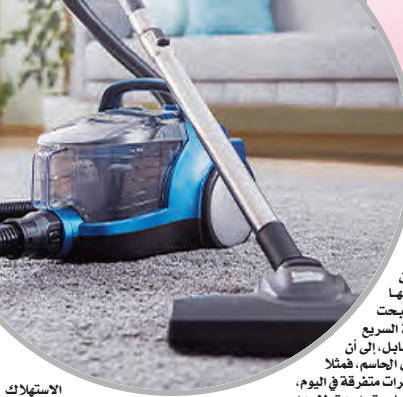
الاستهلاك دون ضغورة حقيقية، وأضاف أن الكثير من الأسر لا تترك أن الأجهزة في وضعية الاستعداد أيضا، تستهلك طاقة

في ظل التحولات المتسارعة، التي يشهدها نمط العيش داخل الأسر، تبرز الأجهزة الكهرومنزلية الحديثة، كأحد أهم عناصر الراحة اليومية وأكثرها تأثيرا على تفاصيل الحياة داخل البيت، ومع إطلاق الحملة الوطنية لترشيد استهلاك الطاقة، مؤخرا، تحت إشراف وزارة الطاقة والطاقة المتجددة، وبمشاركة مؤسسات وهيئات معنية بحماية المستهلك، تستجد النقاشات حول العلاقة بين التطور التكنولوجي والاستهلاك الطاقوي، وحول حدود الاستخدام المسؤول، دون التخلي عن ضروريات أصبحت جزءا من الحياة اليومية.