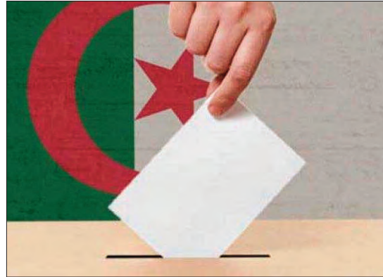
الانتخابية، حيث يتكفل مناضلو الحزب بالعملية، وهو ما ذهبت إليه عضو الأمانة لـ"المساء"، أن مناضلي الحزب هم من

سيسهرون على مراقبة مكاتب التصويت، بالتنسيق مع أحزاب أخرى بولايات الوطن و6 مقاطعات بالخارج، تقديرا منها أن المصلحة المشتركة تفرض مثل هذا التحالف والتنسيق أمام مكاتب مكاتب التصويت الموزعة على 1451 بلدية عبر الوطن. وأضاف أن المراقبة والتنسيق السياسي مع الأحزاب في مراقبة مكاتب التصويت، هي القاعدة الصلبة التي تعد على أسسها المحاضر، التي تعتمد عليها السلطة الوطنية المستقلة للانتخابات في دراسة الطعون التي تقدمها الأحزاب السياسية بشأن النتائج بعد الفرز. وعلى العكس من ذلك، اختارت تشكيلات سياسية أخرى أن تنفرد بمراقبة المكاتب بالولايات التي تشارك فيها، مثلما هو الأمر بالنسبة للتجمع من أجل الشفافية والديمقراطية، حيث أكد رئيس الحزب، عثمان معزوز لـ"المساء"، أن "الأرسيدى" جند مناضليه لمراقبة مكاتب التصويت في 6 ولايات وكذلك للرقابة الأمريكية، التي قدم بها مرشحا. نفس الأمر بالنسبة لحزب جبهة القوى