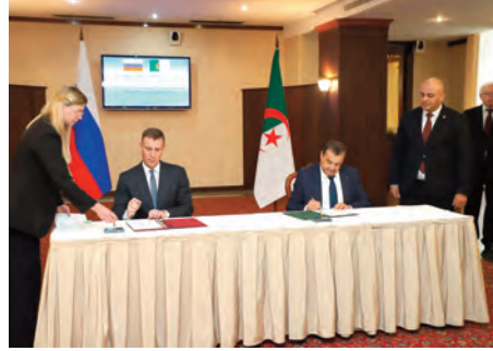
مسؤولين وخبراء وممثلي القطاعات الاقتصادية والعلمية من كلا البلدين. في كلمته الافتتاحية، أكد عرقاب أن انعقاد هذه الدورة يعكس علاقات التعاون التاريخية التي تجمع الجزائر وروسيا، وعمق الشراكة الاستراتيجية

ترأس وزير الدولة، وزير الحرفوات، محمد عرقاب، أمس، بالعاصمة الروسية موسكو، أشغال الدورة الثالثة عشرة للجنة الحكومية المشتركة الجزائرية-الروسية للتعاون الاقتصادي والتجاري والعلمي والتقني، مناصفة مع نائب رئيس حكومة روسيا الاتحادية، ديميتري باتروشييف، الرئيس المشترك للجنة عن الجانب الروسي.