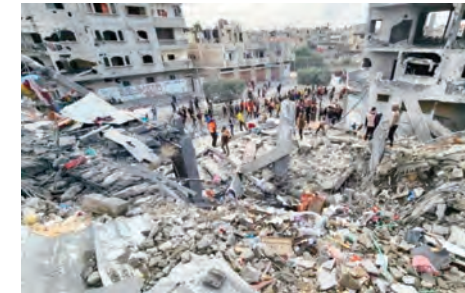
المستوطنين، ولأن جرائم الاحتلال الصهيوني تظل كل فئات المجتمع، فقد أكدت الحركة أن استمرار استهداف المحتل وحماية الشعب والأرض وردع

وطالبت "حماس" الأمم المتحدة والمؤسسات الحقوقية والإعلامية الدولية بتحمل مسؤولياتهم والتحرك المائل لوقف جرائم الاحتلال بحق الصحفيين والمدنيين وتوفير الحماية لهم والعمل على ملاحقة قادة الاحتلال ومحاسبهم على جرائمهم المتواصلة أمام المحاكم الدولية المختصة.