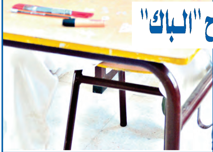
تنصيب اللجنة المتعددة لترقية الصحة المدرسية.. طالحي؛