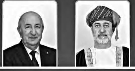
بمناسبة عيد الأضحى المبارك