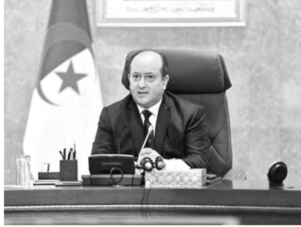
وسيتّم إخضاع هذه الاستراتيجية، بعد اعتمادها من قبل مجلس الوزراء، لمخططات عمل بغرض تنفيذها العملي وفقا

على صعيد آخر، وفي إطار تنفيذ توجيهات السلطات العليا في البلاد الرامية إلى تسريع عملية التحوّل الرقمي وتحديث الخدمات العامة، درست الحكومة، حسب البيان، خطة إطلاق بوابة الخدمات الرقمية الوطنية، حيث تمّ التأكيد على أهمية تعزيز ديناميكية الرقمنة وتوسيع نطاق الخدمات المقدمة، سواء عبر الموقع الإلكتروني أو تطبيق الهاتف المحمول للبواب، وذلك لتوفير خدمات عالية الجودة وسهلة الاستخدام للمواطنين، بما يضمن أثرا إيجابيا للبواب في تقليل التنقل وتبسيط الإجراءات وتعزيز الشفافية الإدارية.