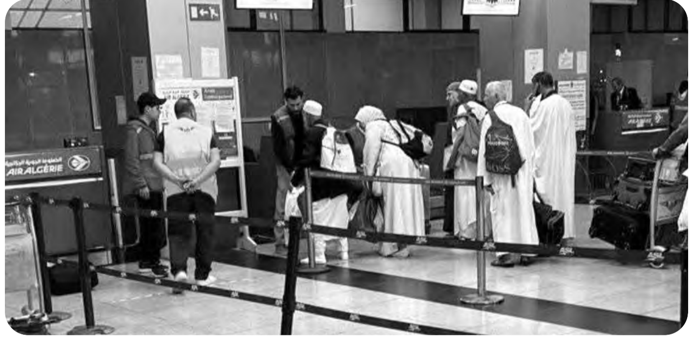
مطار "محمد بوضياف"

وتندرج عملية ترحيل هذه العائلات في إطار القضاء على السكن الهش، مع وضع حد لمخاطر استمرت سنوات داخل سكنات تقتصر لأدنى شروط الحياة، مع إعادة إسكانهم في شقق لائقة، وتوفير كافة المرافق الضرورية.