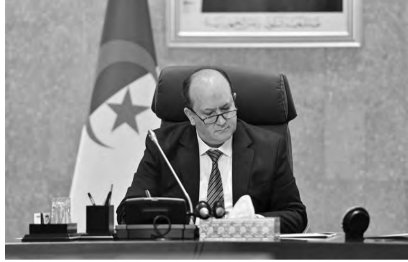
على مدى تقدم أشغال تجديد السكة الحديدية والحصى في شطرب عين سنور - دريعة من خط السكة الحديدية المنجمية الشرقية.

■ متابعة تجديد السكة الحديدية والحصى بشطربين عين سنور - دريعة