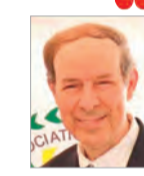
خياطي: تعزيز إنتاج أدوية علاج السرطان وتقليل الاعتماد على الاستيراد

ثمنوا حرص رئيس الجمهورية على تعزيز السيادة الصحية.. خبراء لـ "المساء":