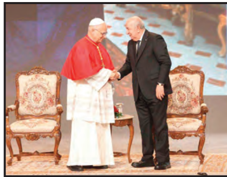
وأبرز عميد جامع الجزائر أهمية الحوار الذي أضفى "ضرورة حضارية" خيارا ثانويا، معربا عن أمه له أن

"ينقل هذا الحوار من دائرة القول إلى فضاء العمل المشترك في مختلف الميادين". كما لفت في هذا الصدد إلى أن المؤسسات الدينية الكبرى في العالمين الإسلامي والمسيحي "مدعوة اليوم إلى صناعة الأمل وبت الطمأنينة"، مؤكدا أن التعاون بينهما بإمكانه أن يشكل "ركيزة لأمن روحي عالمي، يوازي في ضرورته سائر أشكال الأمن التي ينشدها الإنسان".