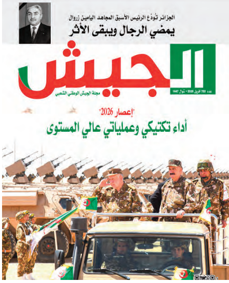
الجزائر فؤاد الرئيس الأسبق المجاهد اليامين زروال يمضي الرجال ويبقى الأثر