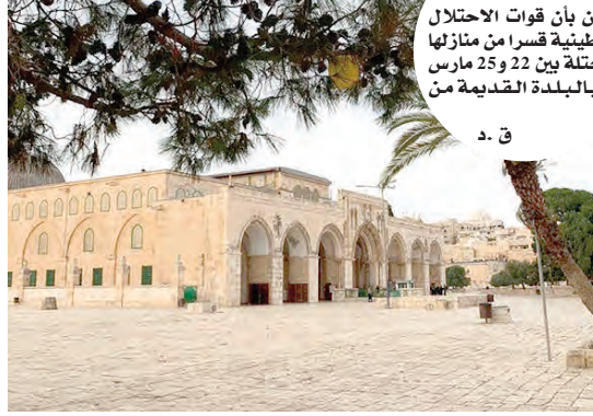
أفاد مكتب الأمم المتحدة لحقوق الإنسان بأن قوات الاحتلال الصهيوني أخلت ما لا يقل عن 16 عائلة فلسطينية قسرا من منازلها في بطن الهوى في سلوان بالقدس الشرقية المحتلة بين 22 و25 مارس الجاري، بهدف تفريغ المناطق المحيطة بالبلدة القديمة من الفلسطينيين واستبدالهم بالمستوطنين.