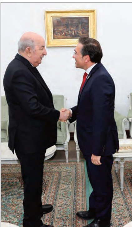
استقبله رئيس الجمهورية.. وزير الخارجية الإسباني

تم استعاء القائم بأعمال سفارة فرنسا في الجزائر، أول أمس، إلى مقر وزارة الشؤون الخارجية للإعراب عن احتجاج الجزائر على القرار الذي الأربعة الماضين، بخصوص تجديد الجبس المؤقت لمدة إضافية قدرها سنة واحدة في حق موظف قنصلي جزائري، حسبما أفاد به وزير الشؤون الخارجية. جاء في البيان "تم استعاء القائم بأعمال سفارة فرنسا في الجزائر بتاريخ 26 مارس الجاري إلى مقر وزارة الشؤون الخارجية، وقد جاء هذا الاستدعاء للإعراب عن احتجاج الجزائر، وبإشاد العبارات، على القرار الذي صدر يوم أمس بخصوص تجديد الجبس المؤقت لمدة إضافية قدرها سنة واحدة في حق موظف قنصلي جزائري". وتم، وفقا لنقش المصدر، لفت انتباه الدبلوماسية الفرنسية بشكل