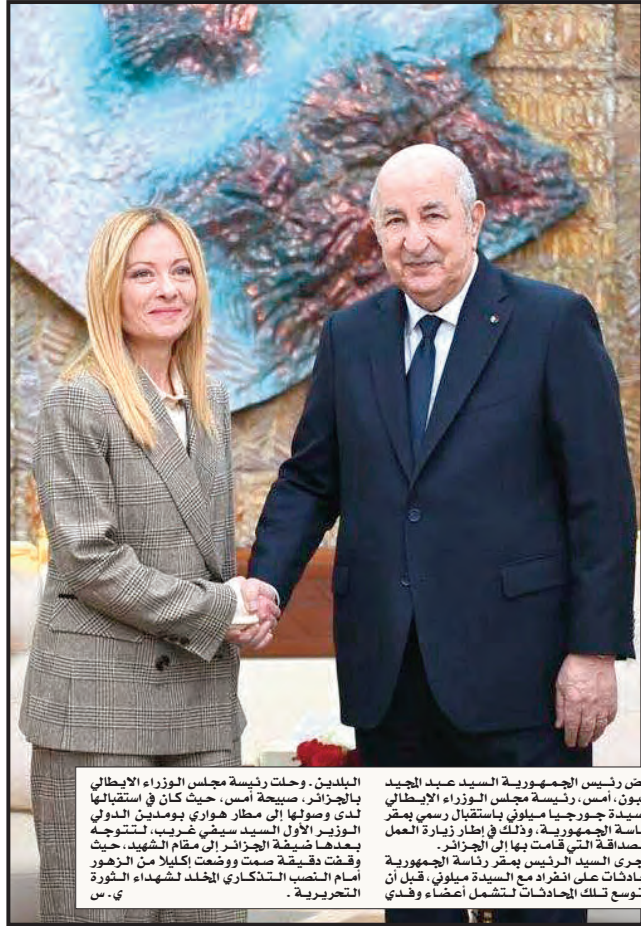
حضر رئيس الجمهورية السيد عبد المجيد تبون، رئيسة مجلس الوزراء الإيطالية جورجيا ميلوني، جلسة مجلس الوزراء الإيطالي في تونس، 26 مارس 2026. وتحت إشراف الرئيس سرجيو ماتاريليا، جرى توقيع بيان مشترك بين البلدين يحدد آفاق التعاون بين البلدين في مجالات الطاقة، والتجارة، والثقافة، والعلاقات الإنسانية. وتضمن البيان تأكيداً على أهمية العلاقات الثنائية بين البلدين، وضرورة تعزيزها في مختلف المجالات. كما أكد الجانبان على أهمية الحوار والتعاون في القضايا ذات الاهتمام المشترك، وضرورة تعزيزها في مختلف المجالات. وتضمن البيان أيضاً تأكيداً على أهمية العلاقات الثنائية بين البلدين، وضرورة تعزيزها في مختلف المجالات. كما أكد الجانبان على أهمية الحوار والتعاون في القضايا ذات الاهتمام المشترك، وضرورة تعزيزها في مختلف المجالات.

■ الجزائر حريصة على الوفاء بالتزاماتها كشريك موثوق لإيطاليا ■ ملتزمون بتعميق التعاون في مجالات المؤسسات الناشئة والتكنولوجيا ■ تسريع إجراءات إنشاء الغرفة التجارية الجزائرية-الإيطالية ■ إشادة بالخطوات المتسارعة لتجسيد مشاريع "خطة ماتي" ■ تعزيز التعاون الثنائي في المجالات الثقافية والعلمية والإنسانية ■ التأكيد على حل عادل ضامن لحق الصحراويين في تقرير المصير ■ دعوة للوقف الفوري للتصعيد في الشرق الأوسط وتغليب الحوار والدبلوماسية