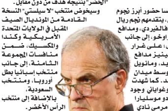
القائمة غياب متوسط ميدان

وهذه قائمة بيليسا حضور أبرز نجوم المنتخب الأوروغواياني، يتقدمهم نجم ريال مدريد فيديريكو فالفيرو، ومدافع برشلونة رونالد أراوخو، إلى جانب أسامة يلارزة أخرى، على غرار خوسيه ماريا كيمييزينز مدافع أتليتيكو مدريد، وماتوول أغارتي متوسم ميدان مانستر يونايتيد، كما شهدت قائمة المنتخب الأوروغواياني وجود اسم الخضر فيرناردو موسليبارا (39 عاما)، حارس مرمرى نادي إستودينتيس الأرجنتيني، بالإضافة إلى داروين نونيز مهاجم الهلال السعودي، وفي المقابل، عرفت القائمة غياب متوسط ميدان