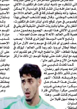
القائمة غياب متوسط ميدان