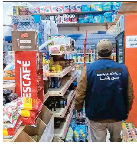
التعاون بين الجزائر والنيجر يمر إلى السرعة القصوى

حق المخالفين طبقا للتشريعات والتطبيقات المعمول بها. وأفاد البيان بأن مصالح الوزارة تلقت عبر التطبيق الإلكتروني "مرافق كوم" 7 بلاغات تتعلق بعدم التزام بعض التجار بنظام المداومة وذلك على مستوى ولايات البويرة، سطيف، الشلف، وتيسة في ثاني أيام العيد، حيث تم الشروع في عمليات التحقق الميداني واتخاذ الإجراءات القانونية اللازمة. كما أظهرت بيانات التطبيق، تسجيل 23845 عملية بحث عن التجار المداومين يبلغ بذلك إجمالي عدد عمليات البحث 60740 عملية خلال يومين. وبخصوص التطبيق الإلكتروني "مرافق كوم"، فتم تسجيل 36895 عملية بحث عن التجار المداومين، "ما يؤكد أهميته كدليل رقمي ضال يساهم في تسهيل وصول المواطنين إلى المعلومات المتعلقة بتقاطيع البيع والخدمات المتاحة". وبالمناسبة أشادت الوزارة بروح المسؤولية التي تحل بها التجار المداومون، منوهة بالتزامهم وحرصهم على تقديم خدماتهم للمواطنين خلال هذه المناسبة الدينية.