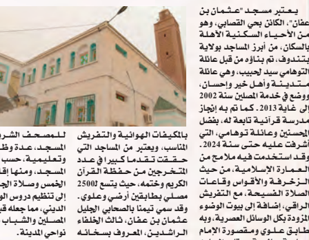
يعتبر مسجد "عثمان بن عفان"، الكائن بحي القصابي، وهو من الأحياء السكنية الأهم بالمسجد بولاية تندوف، تم بناؤه من قبل عائلة التهامي سيدي لحيب، وهي عائلة مستدينة وأهل خير واحسان، ووضعت في خدمة المصلين سنة 2002 إلى غاية 2013. كما تم به إنجاز مدرسة قرآنية تابعة له، بفضل الإحسان وعائلة توهامي، التي اشرفت عليه حتى سنة 2024. وقد استخدمت فيه ما لمع من المروءة بكل الوسائل العصرية، وبه طابع علوي ومضرد الإمام وساحة جانبية، يرتادها المصلون من كل أنحاء المدينة. كما تم تجهيز

بان لهذا الأخير، رسالة تعليمية أخرى، تتجلى في تعليم القرآن للأطفال والشباب، إضافة إلى مساهمته الضعالة في إحياء المناسبات الدينية، لاسيما في شهر رمضان الفضيل. كما يتقوم باحتضان حلقات تضييق القرآن الكريم، وللمسجد نشاطات مكثفة خلال شهر رمضان، منها إقامة صلوات التراويح ومسابقات حفظ صلاة القرآن، إضافة إلى العمل الإنساني والخيري المتمثل في موائد الإفطار جماعية، والتكافل الاجتماعي مع الأسر العوزة واليتيمات، إضافة إلى قيامه بعمليات التطهير، ويودي للمسجد، عدة وظائف دينية وتعليمية، حسب ما أفاد به إمام المسجد، عثمان بن عفان، ثالث الأقطاء المرشدين، المعروف بسخائه وخدمته للإسلام، وجمعه