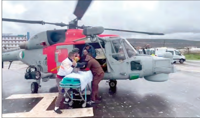
تندرج هذه العملية في إطار المهام الإنسانية لوحدة حرس السواحل لقيادة القوات البحرية، والتي تعكس الجهود المبذولة ومدى حرصهم على التدخل لإنقاذ الأرواح البشرية في عرض البحر في جميع الظروف.

وأوضح المصدر أن وحدة الحماية المدنية لبيني مراد، بدعم من وحدات الحماية المدنية لبوفاريك والوحدة الرئيسية للحماية المدنية، تدخلت في حدود الساعة الواحدة و13 دقيقة على مستوى الطريق السريع شرق-غرب بني تامو باتجاه الجزائر العاصمة، إثر حادث مرور تسلسلي بين 6 سيارات سياحية. وخلف الحادث 6 جرحى من بينهم اثنان في حالة حرجة، حيث تم تقديم الإسعافات الأولية لهم وإجلائهم نحو المستشفى الجامعي "فرانس فانون" لتلقي العلاج اللازم. كما سجلت ذات المصالح وفاة شخص وإصابة ثلاثة آخرين بجروح مختلفة في حادث آخر وقع فجر أمس، إثر اصطدام بين سيارة السريع موزاية باتجاه الجزائر بالقرب من محطة الخدمات ببلدية الشفة.