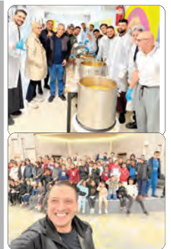
خصص بها الأبطال المصابون بالسرطان

ويجدر البروفيسور بوقارة من مخاطر الجلوس المطول، خاصة من الفئة العاملة، التي تقضي ساعات طويلة أمام المكاتب أو الشاشات، موصياً بالتهويز من الكرسي مرة واحدة على الأقل كل نصف ساعة؛ للقيام ببعض التمارين البسيطة، فالبحوث العلمية، كما يشير، أثبتت أن الجلوس