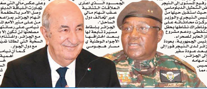
أكد أن موقف الجزائر إزاء النزاعات بالقارة ثابت.. الرئيس تبون،

يقوم رئيس جمهورية النيجر، رئيس الدولة، الفريق عبد الرحمان تياتي، بداية من اليوم، بزيارة أخوة ودية إلى الجزائر على رأس وفد هام، وذلك بدعوة من رئيس الجمهورية، السيد عبد المجيد تبون، حسب ما أفاد به أسس، بيان لرئاسة الجمهورية . وجاء في البيان "بدعوة من رئيس الجمهورية، السيد عبد المجيد تبون، يقوم الفريق عبد الرحمان تياتي، رئيس جمهورية النيجر، رئيس الدولة، بزيارة أخوة وعمل إلى الجزائر على رأس وفد هام يومي 15 و 16 فيفري الجاري" . وترسي هذه الزيارة إلى "تعزيز أواصر الأخوة والتعاون وحسن الجوار بين البلدين الشقيقين، في إطار ديناميكية جديدة للاستغلال الأحسن لقدرات وإمكاناتهما لتغذية التعاون الجزائري والنيجري" . وتمثل هذه الزيارة أيضا "فرصة لمعالجة مسائل سياسية لها علاقة بالقارة الإفريقية عامة وجوار الساحل الصحراوي خاصة" . وضمن هذا السياق تحمل زيارة رئيس الدولة النيجري، الفريق عبد الرحمان تياتي، إلى الجزائر دلالات عميقة تعكس المنهج الإيجابي الذي تشهده العلاقات الثنائية، بعد استئناف قنوات التواصل السياسي بعد