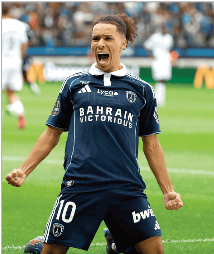
حملوه مسؤولية التعثر أمام "باريس أف سي"

عبر إعلان قبيل، عن سعادته بالتسجيل في مرمى فريق مدينته أولمبيك مرسيليا، والتألق مرة أخرى أمامه، بعد أن رفض مسؤولو هذا النادي انضمامه إليهم، قبل سنوات، ونجح لاعب "باريس أف سي" في منح نقطة التعادل لفريقه، في الدقائق الأخيرة من المباراة، كما عزز رصيده التهديفي، ينافس هدافي البطولة الفرنسية. ت. عمارة