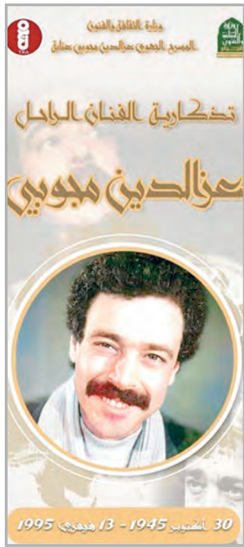
30 أكتوبر 1945 - 13 فيفري 1995

ويُعد الفنان الراحل عز الدين مجوبي واحداً من أملاك المسرح الجزائري، الذين ساهموا بشكل كبير في بناء وإزدهار هذا الفن في الجزائر. وكان مسرحه دائماً مرآة تعكس هموم المجتمع