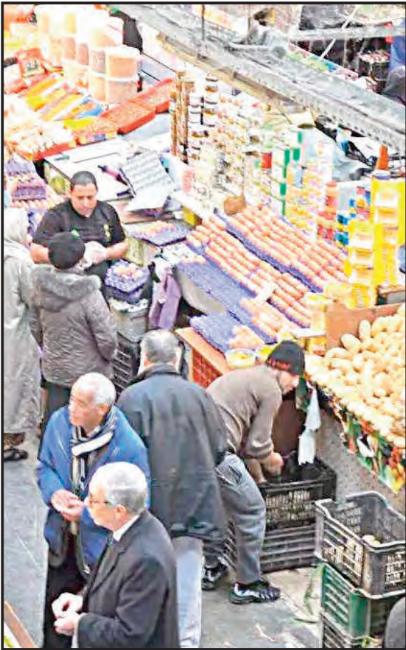
زيارة روايال تكشف مكامن الخلل المتفعل من اليمين المتطرف الفرنسي