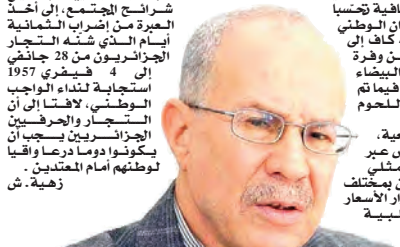
لتعزيز فرص إدماجهم الفعلي في سوق العمل.. سايجي: مسارات تكوينية نوعية للمستفيدين من منحة البطالة

وتم خلال اللقاء تكريم إطارات و فرق جواركية متميزة، إلى جانب عائلات شهداء الواجب الوطني من الأعلام الجواركية ومرحومين متميزين، عرفا فاني جودهم وسهامتهم في خدمة الوطن.