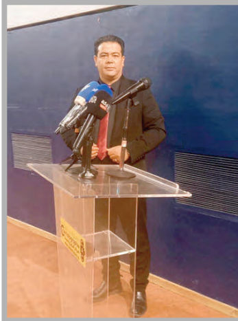
قادرة على مواكبة الساحة الدولية في المستقبل القريب.

ظهر بوعلام في الفيلم وهو رجل أصم وأبكم، يجلس في مدخل سينماتيك يحسني قهوته، أما في الليل، فيشاهد الأفلام القديمة مثل فيلم "عظلة المفتش طاهر" لموسى حداد، وسط صور له مع أسماء وإزينة في الفن السابع، وأخرى ملصقات لأفلام عالمية، كان لها نصيب من العرض في هذه القاعة، وكأنه احتفى بهذه القاعة، حتى في زمن العشرية السوداء، وأصبح هو سينماتيك، والعكس صحيح.