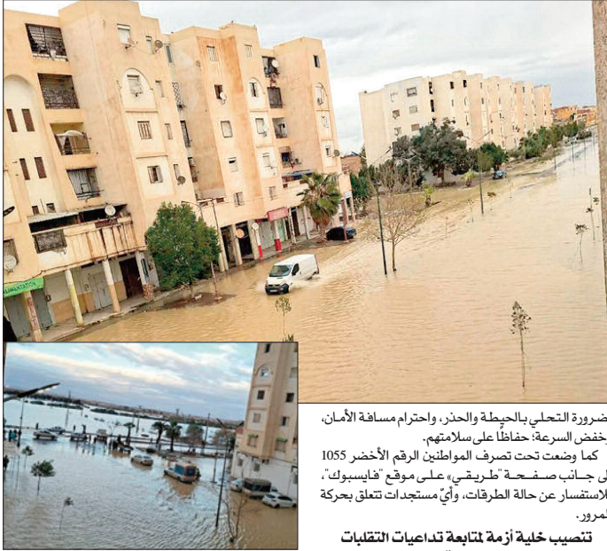
ضرورة التحلي بالحيطه والحذر، واحترام مسافة الأمان، وخفض السرعة، حفاظا على سلامتهم.

كما وضعت تحت تصرف المواطنين الرقم الأخضر 1055 إلى جانب صفحة «طريقي» على موقع «فيسبوك» للاستفسار عن حالة الطرق، وأي مستجدات تتعلق بحركة المرور.