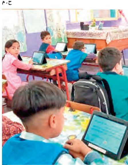
م. ح. وقال سعداوي خلال جلسة علنية بالمجلس الشعبي الوطني خصصت لطرح الأسئلة الشفوية، أول أمس، أنه تطبيقاً لتوجهات رئيس الجمهورية سيتم تعميم تجهيز المدارس الابتدائية بالألواح الإلكترونية على المستوى الوطني مع نهاية السنة الجارية خاصة في ظل رصد مبلغ مالي معتبر لتجسيد هذه العملية.

أعلن وزير التربية الوطنية، محمد الصغير سعداوي، أنه سيتم تعميم تجهيز المدارس الابتدائية بالألواح الإلكترونية على المستوى الوطني مع نهاية السنة الجارية خاصة في ظل رصد مبلغ مالي معتبر لتجسيد هذه العملية.