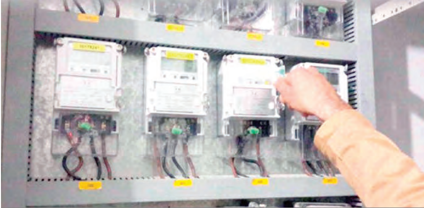
جانب رفع دعاوى قضائية ضد المتورطين، 259 سرقة مست توصيلات الغاز

أما في قطاع الغاز، فأضاعت ببودولة، أن المديرية أحصت 259 حالة اعتداء وسرقة شملت 63 حالة سرقة شملت 33 حالة على مستوى الشبكة الغازية والتوصيلات الداخلية للعمارات، بخسائر إجمالية قدرت بـ 432 مليون سنتيم، منها 63 حالة سرقة شملت 33 حالة على مستوى الشبكة الغازية، و30 حالة على التوصيلات الداخلية للعمارات، تتعلق أساسا بسرقة النحاس، بقيمة مالية إجمالية بلغت 127 مليون سنتيم، كما تم تسجيل 96 حالة اعتداء على الشبكة الغازية، بطول إجمالي قدره 1.5 كلم، إضافة إلى 176 حالة اعتداء على التوصيلات، بكلفة إجمالية تهاوت بـ 168.8 مليون سنتيم، حيث تم في جميع هذه الحالات، رفع دعاوى قضائية لدى الجهات المختصة.