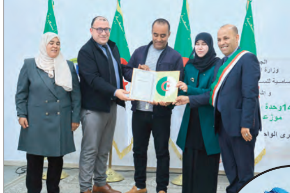
المرحلة عن عدة مناطق فلاحية.