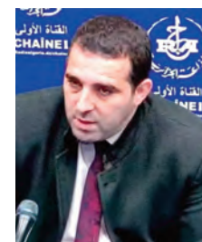
مراقبة نتيج التداول الآلي للبيانات والوثائق الإدارية، بما يكرس فعليا مبدأ الإدارة في خدمة المواطن.

في سياق متصل، أكد المتحدث أن المواطن بات يشعر براحة أكبر عند الاستفادة من مختلف الخدمات التي تقدمها 13 هيئة تابعة لقطاع العمل والتشغيل والضمان الاجتماعي، لاسيما شهادة الانتساب التي يطلبها تقليديا ملايين العمال، والتي أصبحت متاحة للتداول بين الهيئات وعبر المنصات الرقمية، مشيرا إلى أن القطاع يضم حاليا 30 منصة