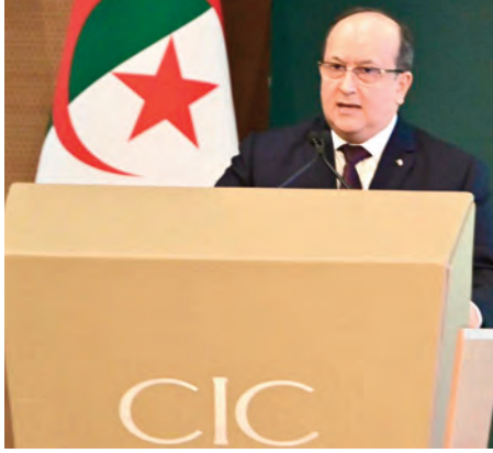
أكد الوزير الأول السيد سفيان غريب، أمس، عزم الجزائر على وضع بيئة قانونية آمنة ومستقرة تسهل وتشجع الاستثمار والمبادرة والابتكار، بما يساهم في ترقيّة الاقتصاد الوطني وتعزيز مكانة الجزائر كقوة رائدة إفريقيا ومركز موقوت اقتصاديا وأمن قانونيا، ويكرس ثلاثة مبادئ الشفافية والمساءلة والنزاهة.