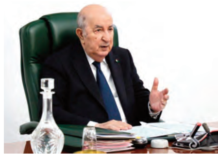
مثل هذه العمليات وفق الأطر القانونية المحددة، كما أمر وزير الفلاحة والداخلية، بالتنسيق والحرس وفق كساد بعض المحاصيل الزراعية، وهذا

أما فيما يتعلق بالاستراتيجية الوطنية لتطوير التجارة الإلكترونية، اعتبرها رئيس الجمهورية تحدياً كبيراً، يتطلب مشاركة الجميع لبلوغ هذا الهدف الاقتصادي، باستخدام الوسائل الضرورية لا سيما ضمان الأمن الرقمي وإقرار مزيد من التسهيلات وتشجيع التجارة في هذا الاتجاه، في حين أكد أن الشفافية التجارية تمثل الهدف الأول والثمرة الحقيقية للرقمنة والتجارة.