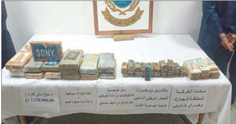
تمكنت الفرقة المتقلة للتفتيش التابعة لمفتشية أقسام الجمارك بوهران خارجي وبالتنسيق مع مفزة للبيد الوطني الشعبي، من تنفيذ عملية نوعية، أسفرت عن حجز 18,074 كلغ من مادة الكوكايين، و3,380 كلغ من الكيف المالح. وكشفت مصالح الجمارك بوهران، أن العملية تعكس مستوى التسقيف، والتجند الدائم لمختلف أجهزة الدولة في مكافحة الاتجار غير المشروع بالمخدرات، حفاظا على أمن الوطن، وسلامة المواطنين.