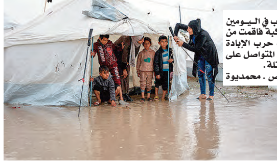
خلف المنخفض الجوي الذي ضرب في اليومين الأخيرين قطاع غزة كارثة إنسانية مركبة فاقمت من معاناة المدنيين، خاصة في ظل تداعيات حرب الإبادة الجماعية والإحصار الصهيوني الخانق المتواصل على هذا الجزء من الأراضي الفلسطينية المحتلة.