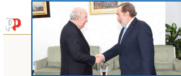
سفير إسبانيا المنتهية مهمته:

كما نقل تحيات رئيس الشيلي، السيد غابريال بوريتش، إلى رئيس الجمهورية السيد عبد المجيد تبون. بدوره، أكد السفير الجديد لجمهورية سلوفاكيا، مارك موران، رغبة بلاده في توطيد العلاقات الثنائية بين البلدين وتوثيق التعاون في عدة مجالات. وأشار إلى أن العمل جار لفتح سفارة سلوفاكيا بالجزائر، وهو ما سيتم قريبا، متوثقا عند مختلف مجالات التعاون بين البلدين، السياسية منها والاقتصادية بالإضافة إلى التربية والعلوم والثقافة. على أعرب عن أمه في مواصلة الحوار السياسي بين البلدين، على أعلى مستوى. خاصة في ظل الزيارة المرتقبة للوزير الأول ورئيس الجمهورية السلوفاكية للجزائر.