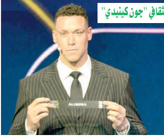
قواعد جديدة تحكم القرعة واحفالية متميزة بالمركز الثقافي "جون كينيدي"

أوقعت أمس، قرعة كأس العالم 2026 المنتخب الوطني في المجموعة العاشرة إلى جانب منتخب الأرجنتين بطل النسخة الأخيرة بقطر، ومنتخب النمسا بذكريات الأثر من "فضيحة خيخون" والتامر التاريخي على "الخضر" في مونديال إسبانيا 1982 والمنتخب الأردني، وعرف حفل القرعة لأول مرة حضورا رئاسيا حيث سحب الرئيس الأمريكي دونالد ترامب ورئيسة المكسيك كلوديا باركو ورئيس وزراء كندا مارك كارني، أسماء منتخبات بلادهم رمزيا لتستأجر على رأس المجموعات الرابعة والأولى والثانية على التوالي.