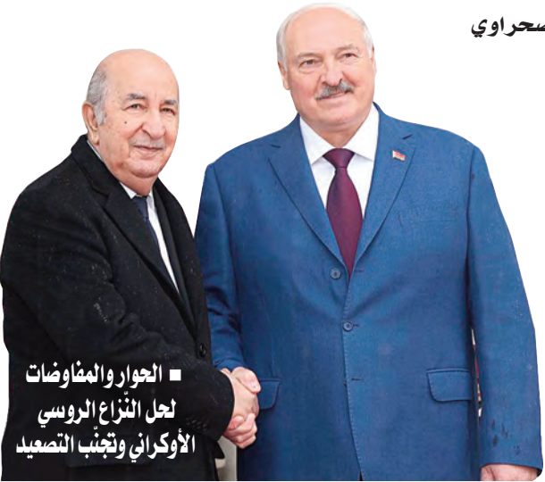
■ الحوار والمفاوضات لحل النزاع الروسي الأوكراني وتجنب التصعيد

الرئيس تبون يشرف رفقة نظيره لوكاشينكو على مراسم توقيعها