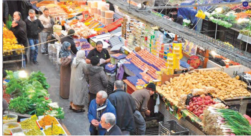
والمواد الغذائية الأساسية، لا سيما ذات الضرورية خلال شهر رمضان المعظم، من حيث التموين المنتظم للأسواق بمختلف السلع والأسعار. وتأتي هذه الإجراءات ضمن مساعي السلطات المركزية لتوفير كل الشروط