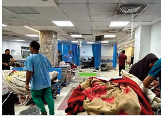
نوفمبر الماضي، تم توزيع حوالي 160 خيمة

تتفاقم أزمة عشرات آلاف الجرحى والمرضى في قطاع غزة، الذين هم بحاجة ماسة للإجلاء الطبي في ظل مواصلة الاحتلال الصهيوني غلق العابر وتضييق الخناق على دخول المساعدات الإنسانية، خاصة الأدوية والمستلزمات الطبية الضرورية والمنقذة للأرواح.