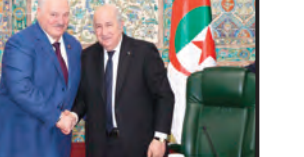
الرئيس تبون يشرف رفقة نظيره لوكاشينكو على مراسم توقيعها

وأكد الرئيس تبون، أن الزيارة الرسمية التي يقوم بها إلى الجزائر نظيره البيلاروسي هي الأولى على هذا المستوى وتعتبر عن إرادتنا السياسية المشتركة الرامية لتعزيز العلاقات بين البلدين، وبتعاون واعد في إطار مؤسستي مستدام. وأكد الرئيس تبون، أن الزيارة الرسمية التي يقوم بها إلى الجزائر نظيره البيلاروسي هي الأولى على هذا المستوى وتعتبر عن إرادتنا السياسية المشتركة الرامية لتعزيز العلاقات بين البلدين، وبتعاون واعد في إطار مؤسستي مستدام.