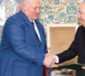
الرئيس تبون يشرف رفقة نظيره لوكاشينكو على مراسم توقيعها

الجزائر دخلت خطوات عملاقة مع بيلاروسيا لتوسيع مجالات التعاون وتجنب التصعيد على أساس التعاون