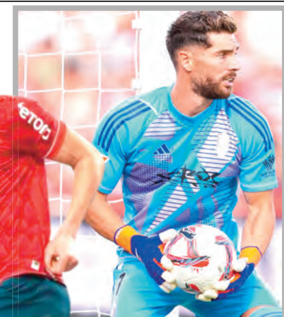
قبل أيام من انطلاق كأس أمم إفريقيا

خمس أشهر، أي شهر ماي على أقصى تقدير وفي حال عاد إلى المشاركة في مباريات الترجي التونسي، وقدم مستوياته المعروفة، يمكنه دخول حسابات المدرب فلاديمير بيتكوفيتش مرة أخرى، للمشاركة في كأس العالم 2026، وهي المنافسة التي لم يسبق له المشاركة فيها أحد الآن، ورغم أن لاعب الترجي لم يكن معنيا بترخيص "الخضر" الأخير حتى قبل إصابته، فإنه يتواجد بانتظام في حسابات المدرب السويسري، الذي فضل تجريب أسماء جديدة في تريبس السعودية، تحضيرا لكأس إفريقيا 2025.