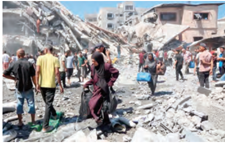
على إعادة بناء نفسها كمكان للمعيشة ومجتمع، موضحة أن العمليات العسكرية الإسرائيلية حول غزة من حالة تلطف إلى حالة ملام شامل.

وأوضح قاسم أن استمرار الحصار الصهيوني ومنع الإعمار، مع الدمار في القطاع والأحوال الجوية القاسية، يشكل امتدادا للحرب الإبادة الجماعية باستخدام أدوات أخرى، ودعا الجامعة العربية والمنظمة التعاون الإسلامي والأمم المتحدة إلى اتخاذ خطوات جادة لإنقاذ أهالي قطاع غزة في ظل دخول فصل الشتاء، الذي يضاعف معاناة النازحين بشكل غير محتمل.