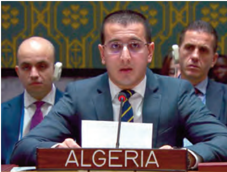
يكفل التحقيق في مختلف الجرائم والانتهاكات وضمان محاكمة عادلة وتعزيز المسالة عن الجرائم والانتهاكات. كما تتي على التعاون الإيجابي القائم بين الحكومة الليبية وقبول اختصاص المحكمة

ي. س السلطات الليبية والمحكمة الجنائية الدولية، بما من شأنه تسريع وتيرة التحقيقات الجارية تمهيدا لإغلاقها في أقرب الأجل الممكنة. وأكد أن الجزائر تشدد على ضرورة اضطلاع المجتمع الدولي ومقدمته منظمة الأمم المتحدة بمسؤولياته في دعم قطاع العدالة في ليبيا من خلال تكتيف برامج التدريب وبناء القدرات ونقل الخبرات بما يمكن هذا القطاع من أداء مهامه بفعالية، باعتباره صاحب الولاية القضائية الأصلية والأصيلة.