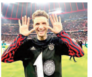
يرى هيربرت هاينز، رئيس نادي بايرن ميونخ، أن توماس مولر، لاعب الفريق السابق، من الممكن أن يعود للنادي بعد استئصال كرة القدم، في تصريحات نقلتها صحيفة "بكيكر" وقال هاينز، في تصريحات نقلتها صحيفة "بكيكر".