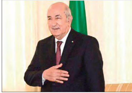
المنعفة بين البلدين، سيستمر في التطور لمصلحة الشعبين، متطلعا إلى مزيد من التعزيز والتوثيق لهذه الروابط. كما تمنى للسيد الرئيس التوفيق في قيادته الحكيمة للبلاد، والخير والرفاه للشعب الجزائري. من جهته، تقدم رئيس جمهورية جيبوتي، السيد اسماعيل عمر جيله، باسمه الشخصي وباسم شعب جيبوتي الشقيق، بأحر التهاني

تتوالى تهاني قادة رؤساء الدول الموجهة لرئيس الجمهورية، السيد عبد المجيد تبون، بمناسبة احتفال الجزائر بالذكرى الـ71 لاندلاع ثورة الفاتح نوفمبر المجيدو، حيث وردت رسائل تهاني جديدة من قبل ملك مملكة السويد، كارل غوستاف، ورؤساء كرواتيا السيد زوران ميلانوفيتش، تاجيكستان، السيد امام علي رحمان، جيبوتي، السيد اسماعيل عمر جيله وموريتانيا السيد محمد ولد الشيخ الغزواني، وقفما أوردته أمس، مصالح رئاسة الجمهورية.