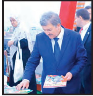
وزير الاتصال خلال زيارته لصالون الكتاب