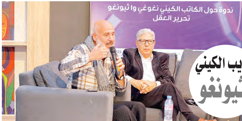
ندوة حول الكاتب الكيني نغوي و ثيونغو تحرير العقل

أضاف بورايو أنه تعرّف على العديد من المدّاحين، شبابا وشيوخا في منطقتي بسكرة ووادي سوف بين عامي 1976 و1978، أثناء إعداده لشهادته التي قدّمها بجامعة القاهرة، نظرا لعدم وجود تخصص في الأدب الشعبي بالجزائر آنذاك. وأوضح أنه تغلغل في أسرار المدّاحين وأطلع على طباعهم وصفاتهم وموضوعات مديحهم، إذ عايشوا أحداث الفترة الاستعمارية وما بعدها، فكانوا يحقّ