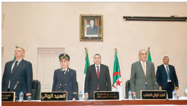
السيد الوالي المنتدب