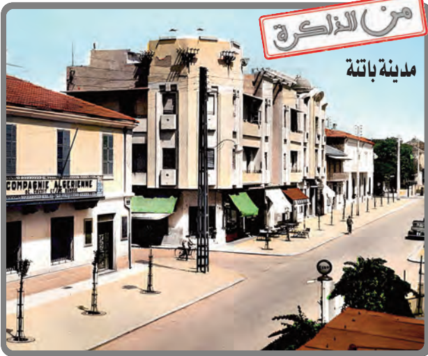
من الذائرة مدينة باتنة