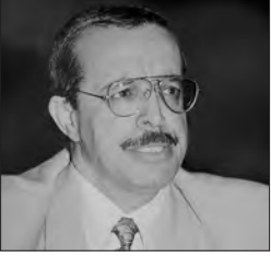
ويلهم ذويه جميل الصبر والسلوان ويسكنه فسيح جناته.