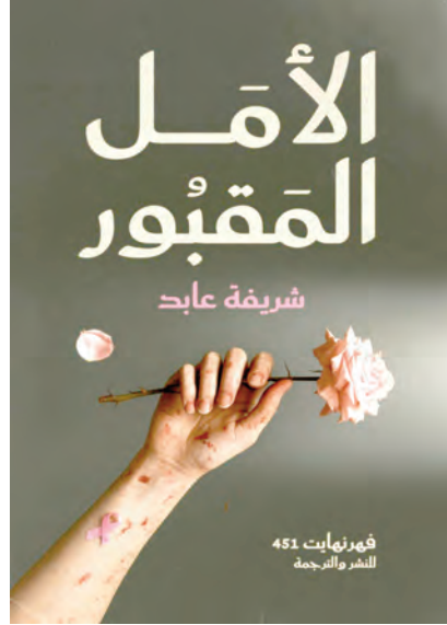
فهرنهايت 451 للنشر والترجمة