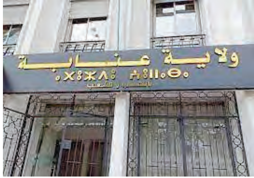
في المناطق الريفية والثابتة.

وعكس هذا الاجتماع التنسيقي روح الجدية والمتابعة التي تتبناها مصالح ولاية عنابة في تسيير الشأن المحلي، وفق أولويات واضحة ومتراصة، تتركز على البيئة، والتربة، والبنية التحتية، والخدمات الحيوية؛ كالصحة، في إطار تجسيد توجهات الدولة ميدانيا، والرفع من جودة حياة المواطنين عبر معالجة الانشغالات الحقيقية بفعالية، واستباقية.