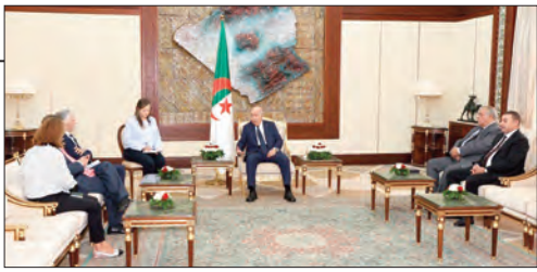
استقبله رئيس الجمهورية.. وزير الداخلية الإسباني، تعاوننا حتمي لأمن الجزائر وإسبانيا

■ عناية الرئيس تبون بالمجلس رستخت مكانته الاستشارية والاستشرافية ■ نحو إنجاز وتوزيع مليوني وحدة سكنية خلال الخماسي الحادي ■ العدالة الاجتماعية ركيزة أساسية في النموذج الوطني التنموي ■ تكيف اقتصادنا مع التحولات المعقدة وتخفيف آثارها على المواطن ■ وضع أساس سليم للإقلاع الصناعي وتنويع الصادرات الوطنية ■ إنجازات الرئيس تبون تسير بالجزائر إلى مصاف الاقتصادات الصاعدة