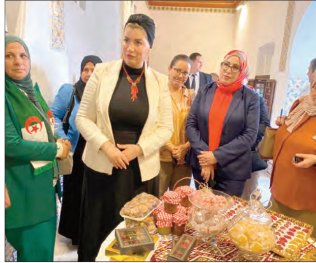
مقدمة التدابير الموضوعة في هذا الشأن، وبالمنااسبة تم تنظيم معرض لمنتجات النساء الريفيات، لإبراز إبداعاتهن في مختلف المهن المرتبطة بمجال الحرف والصناعة التقليدية، كما

كشفت وزيرة التضامن الوطني والأسرة وقضايا المرأة، صورية مولوحي، أول أسس بالعاصمة، عن إطلاق منصة الكترونية للتسويق الرقمي لمنتجات النساء الريفيات والأسر المنتجة.