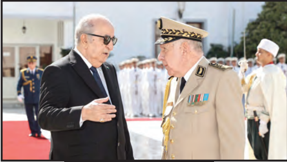
الفريق أول السعيد شنقرجة؛

■ الجاذبية الاقتصادية للجزائر جاءت بفضل استقرارها الذي ساهم فيه الجيش وقوات الأمن ■ الجيش مدافع شرس عن حريتنا وحرمة التراب الوطني والوفاء لرسالة أول نوفمبر ■ محاولة إغراق الجزائر بالمخدرات تستهدف القضاء على مستقبلها وركيزتها الأساسية ■ الجيش والمؤسسات الأمنية بالمرصاد لظاهرة المخدرات التي تستهدف الشباب