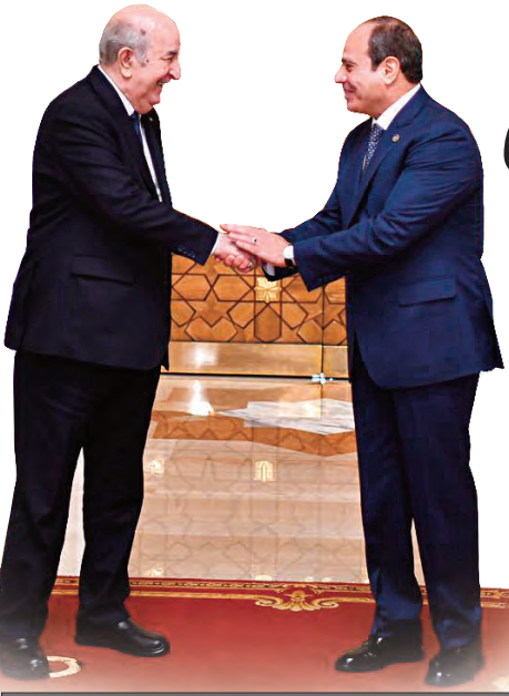
رصدت أزيد من 17600 مليار دينار للتنمية والمواطن

أوضح عطف في كلمة ألقاها بمناسبة إحياء يوم الدبلوماسية الجزائرية والاحتفال بالذكرى الثمانين لتأسيس منظمة الأمم المتحدة، أن علاقة الجزائر بمنظمة الأمم المتحدة متجددة وتميزة، من منطلق أن أول قضية سجلت في جدول أعمال هذه الهيئة تتعلق بتصفيته في الاستعمار هي القضية الجزائرية نفسها يوم 30 سبتمبر 1955، ما يعد سابقة إجرائية تعكس عمق ارتباط الجزائر بمسار الشرعية الدولية. كما لفت وزير الخارجية إلى أن الصدى الذي لاقته القضية الجزائرية، أدى لاحقاً إلى تأسيس اللجنة الخاصة لتصفيته الاستعمار أو ما يعرف بلجنة 24 التي أوكلت لها مهمة متابعة تنفيذ اللائحة 15/14، حيث تضمنت منح الاستقلال