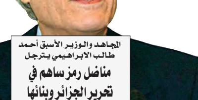
المجاهد والوزير الأسبق أحمد طالب الإبراهيمي يترحل

بعث رئيس الجمهورية، السيد عبد المجيد تبون، أمس، برسالة تعزية إلى عائلة المناضل المجاهد، أحمد طالب الإبراهيمي، الذي وافته المنية عن عمر ناهز 93 سنة، مؤكدا أن الجزائر فقدت برحيله "اسما مذكورا ببطولة ومكانة الشخصيات الوطنية". جاء في نص رسالة التعزية التي وجهها السيد الرئيس إلى عائلة العقيد، "يسم الله الرحمن الرحيم، ومنه من قضى نفيه ومثمن من ساهموا ما عاهدوا الله عليه فهم من قضى نفيه ومثمن من يتظنر وما بدلو (تبدلا)، صدق الله العظيم". وأضاف رئيس الجمهورية يقول "الله أكبر، شاء المولى تبارك وتعالى أن يتوفى الدكتور مرحوم، أحمد طالب الإبراهيمي، سليل بيت العلم والورع. وبرحيله تفقد الجزائر اسما مذكورا ببطولة ومكانة الشخصيات الوطنية ذات القدر المستحق والمكانة المرموقة.. فلقد جمع الراحل خصال حكمة السياسي ورسالة المثقف ووطنية المناضل المجاهد، منذ أن التحق قدينا بالاتحاد