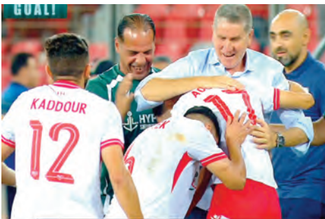
ضربتي جزء من طرف بوخلدة وبياكو.