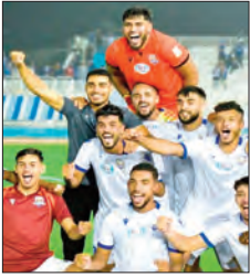
بذلك الترتيب العام للبطولة في أسوأ بداية موسم بالنسبة لنادي "الأكاديمية". وتوفيق

واصل فريقا شبيلية الساورة ومستقبل الرويستات التربع على صدارة ترتيب بطولة الرابطة الأولى "موبيليس" لكرة القدم رغم تعادلها خارج القواعد أمام بنفس النتيجة (1-1)، فيما حققت مولودية وهران الفوز على الضيف نادي بارادو (3-1)، في افتتاح مباريات الجولة السادسة التي انطلقت أول أمس والتي سُنكتمل اليوم.