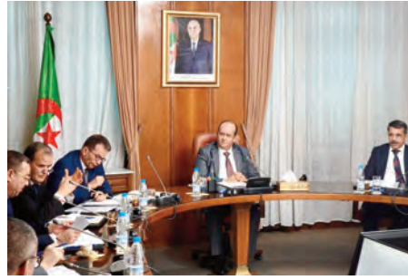
في مجال تصدير الإسمنت، في إطار متابعة تنفيذ تعليمات رئيس الجمهورية المتعلقة بترقية الصادرات وتوسيع الموانئ الاقتصادية

ترشيد استغلال المنشآت التحية لرفع قدرات التخزين والتحكم في التكاليف متابعة تنفيذ تعليمات رئيس الجمهورية المتعلقة بترقية الصادرات وتطوير الموانئ ضمان سيولة أكبر للمواد المصدرة ومعالجة انشغالات المتعاملين الاقتصاديين استثمارات هامة تدخل حيز الخدمة خلال الفترة المقبلة