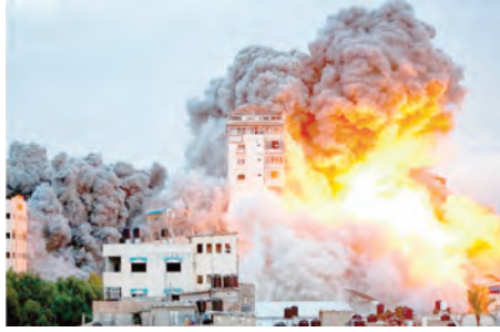
شاهد في مجاز متتالية يرتكبها جيش الاحتلال في الموصي.

ويعد أن "تمتصت "حماس" الحراك الدولي، الرافض لهذا الصمت وتصادد الرفض العالمي للحرب الإبادة في قطاع غزة، دعم كل دول وأحرار العالم إلى تصعيد الإجراءات ضد جيش الاحتلال الفاشي وإجباره على وقف جرائمه وانتهاكات بحق الشعب الفلسطيني".