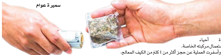
عدة أحياء باستعمال مركبته الخاصة. وأسفرت العملية عن حجز أكثر من 1 كلغ من الكيف المعالج.