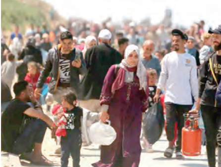
غزة، كما طالب بإدخال الاحتياجات الإيوائية فوراً ودون قيود أو شروط. من جهة أخرى أدان نفس المصدر بأشد العبارات تهديدات الاحتلال باجتياح مدينة

ويتم الاحتلال للمنظومة الصحية في مدينة غزة وشمال القطاع مما أدى لتعطل المستشفيات عن العمل بكامل طاقتها في محاولة بإسائة منه لحمل سكان هذه المناطق على النزوح مجددا إلى الجنوب. وعلى إثر ذلك أكدت سلطات غزة رفضها القاطع لأي خطوة تهدف لنقل المستشفيات من خارج المدينة من خدماتها الصحية، مطالبة المجتمع الدولي بالتدخل العاجل لتعزيز المنظومة الصحية وتجهيز مستشفيات غزة لتقديم الرعاية لكل المرضى والمصابين، وأوضحت في هذا السياق بان المستشفى الأوروبي، لا يمكن أن يكون بديلا عن مستشفيات الشمال، حيث يحتاج لأكثر من 6 أشهر من العمل المتواصل لإعادة تأهيله بعد تدميره بما يشمل البنية التحتية والمعدات والإطار الطبي.