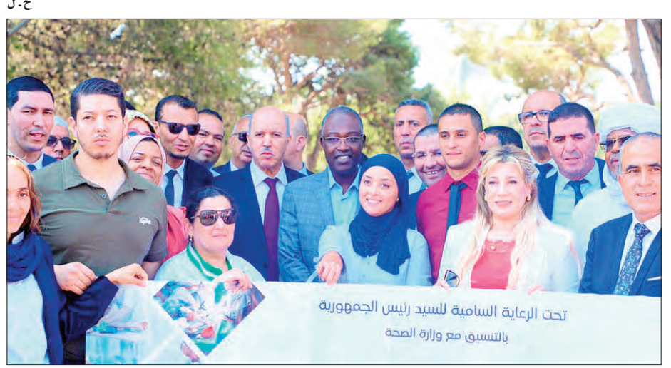
تحت الرعاية السامية للسيد رئيس الجمهورية بالتشويق مع وزارة الصحة

أشرف وزير الصحة، عبد الحق سايحي، رفقة وزير الشباب، المكلف بالجنوب والهضاب العليا، مصطفى حيداي، أول أمس، على انطلاق الطبعة الخامسة للقوافل الطبية التطوعية باتجاه مناطق الهضاب العليا والجنوب الكبير.