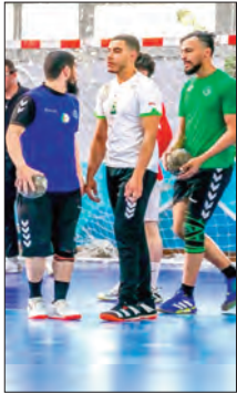
بطوره إلى تمثيل المدينة في أعلى المستويات.

في الوقت الذي لم تشرع العديد من الفرق العنابية في تحضيراتها بعد، يستفيد سريع بونة من عامل الجاهزية المبكرة، وهو ما قد يمنحه أفضلية في انطلاق الموسم، فالفرق بدأ ضبط صفوفه، وقد يشهد دعما بعناصر جديدة حسب احتياجات المدرب، خصوصا في بعض المناصب التي تطلب تعزيزا نوعيا، وهذا العمل المنهجي يعبر عن رؤية جديدة داخل الفريق، تسعى إلى إعطاء الأولوية للتخطيط بدل الارتجال، وهي خطوة مهمة في طريق بناء نادٍ قوي ومنافس.