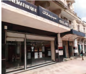
سينما تيك عناية