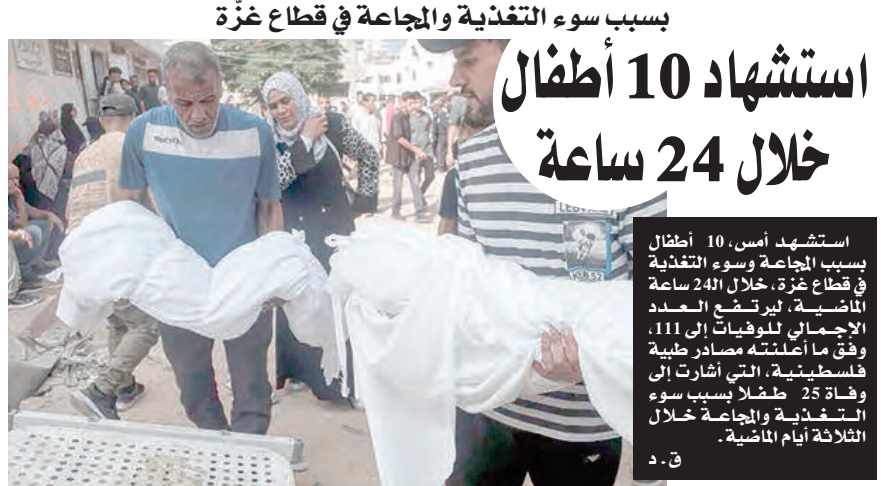
استشهد أمس، 10 أطفال بسبب المجاعة وسوء التغذية في قطاع غزة، خلال 24 ساعة الماضية، ليرتفع العدد الإجمالي للوفيات إلى 111، وفق ما أعلنته مصادر طبية فلسطينية، التي أشارت إلى وفاة 25 طفلاً بسبب سوء التغذية والمجاعة خلال الثلاثة أيام الماضية.

وفي سياق متصل، أكدت ذات المتحدث، أن المغرب لا يسمح بدخول الصحراء الغربية المحتلة "إلا لمن يتجاوب مع استراتيجيته القائمة على تصدير سرديته للعالم الخارجي، ومن بين هؤلاء شركات أجنبية متواطئة في نهج ثروات الشعب الصحراوي وسياح يترددون على منتجعات رياضة ركوب الأمواج وغيرهم، بينما يطرد ويرحل المراقبون والصحفيون من الإقليم المحتل لتثنيهم عن كشف الحقيقة".