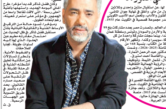
وكان فضل شاكر قد بدأ مؤخرا، طرح أغانيه اليومية الجديد، واستهلها بأغنية "أحلى رسة"، التي لاقت تفاعلا واسعا من الجمهور، في مؤشر على استمرار شعبيته، رغم ابتعادها الطويل.