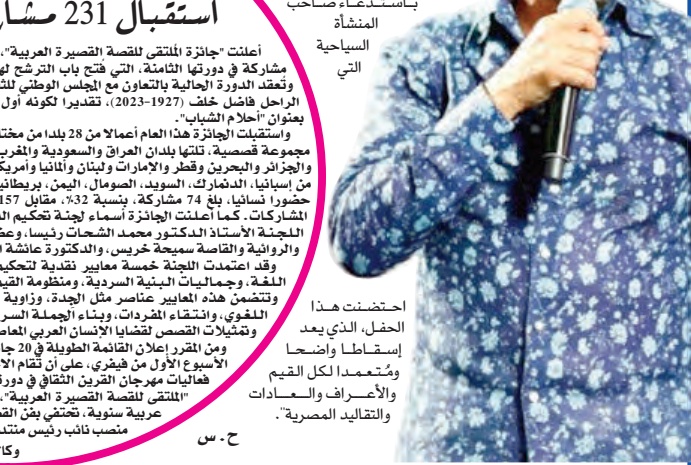
احتضنت هذا الحفل، الذي يند إسقاطا واضحا ومُعتمدا لكل القيم والأعراف والعادات والتقاليد المصرية".