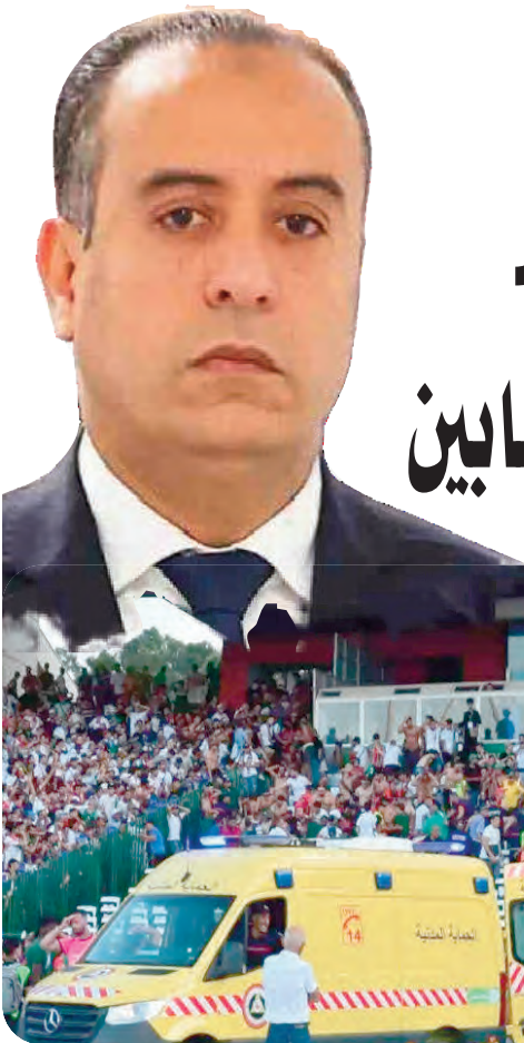
المصاب الجلل، مقدمة أحر التعازي وأصدق المواساة إلى إدارة وجماهير نادي مولودية الجزائر.