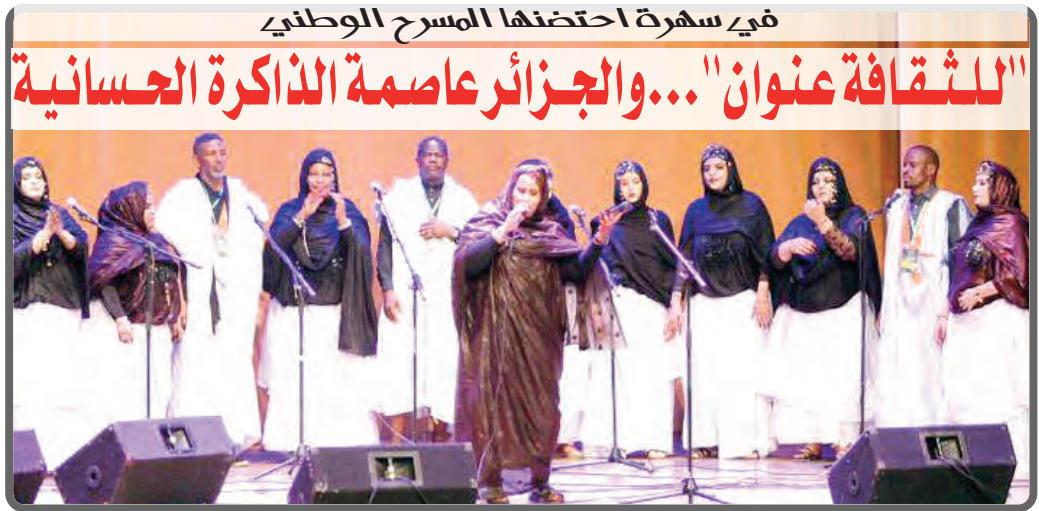
في قلب الجزائر العاصمة وتحت قبة المسرح الوطني الجزائري "محيي الدين بشطارزي"، عانق جمهور الثقافة الحسانية نغمات السلم والوفا، في سهرة جمعت بين الشعر والموسيقى والذاكرة المشتركة. وأكدت، من جديد، أن الثقافة الحسانية ليست مجرد تراث، بل نبض حي يوحّد الشعوب.