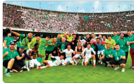
بعد الخسارة أمام "السيكاو" برصيد 36 نقطة.

الوصافة من شباب بلوزداد، بعد رفع رصيدها إلى 56 نقطة، يضم "الكناري" المشاركة في دوري أبطال إفريقيا الموسم المقبل.